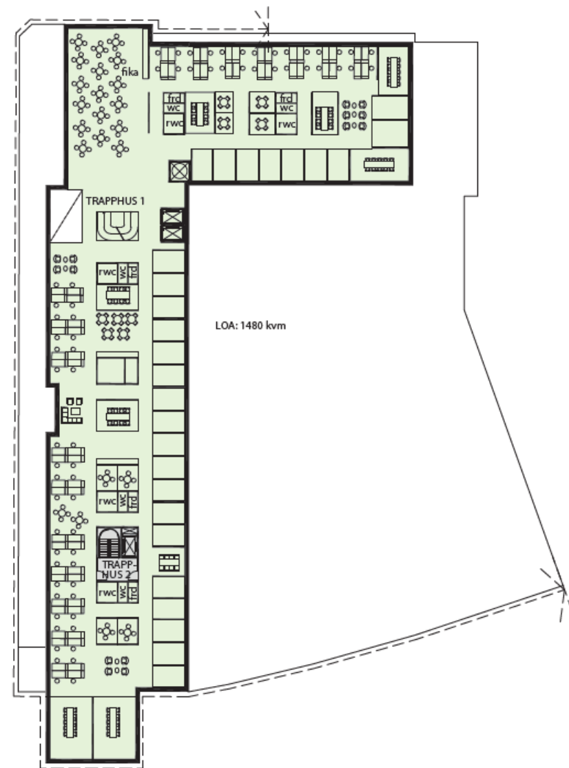
KONTOR - EN HYRESGÄST