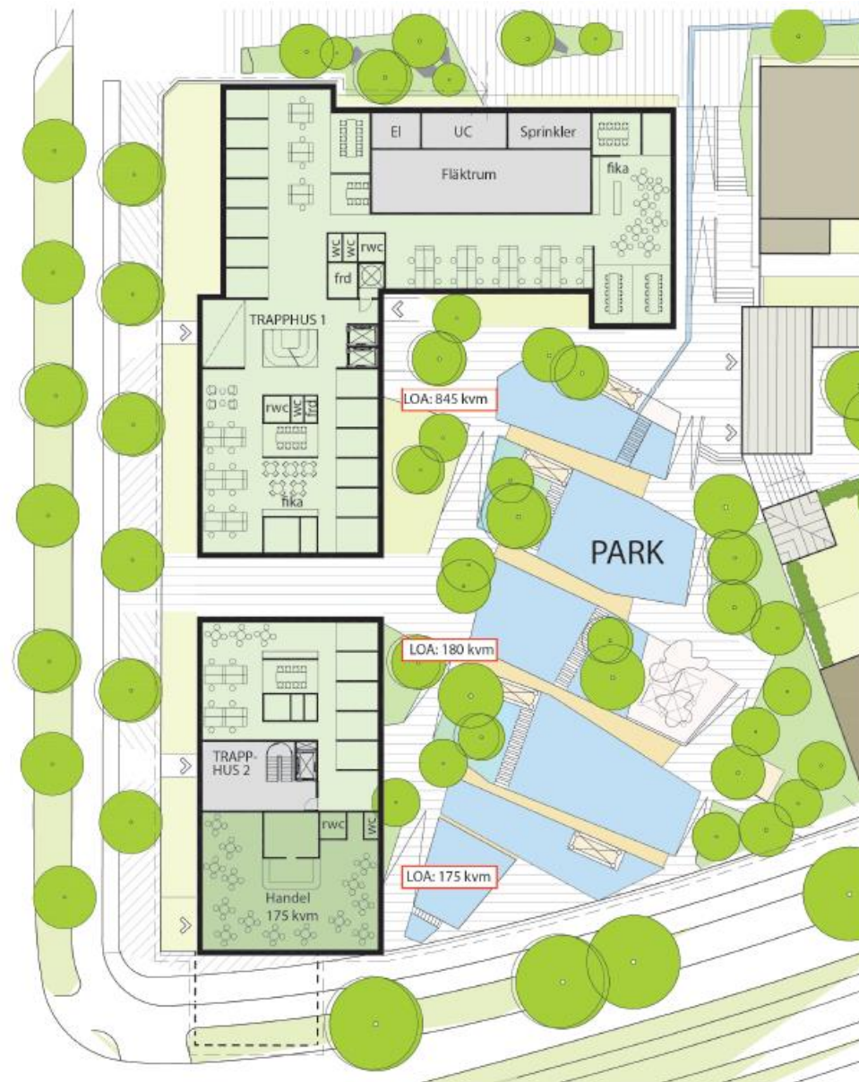
KONTOR - EN HYRESGÄST