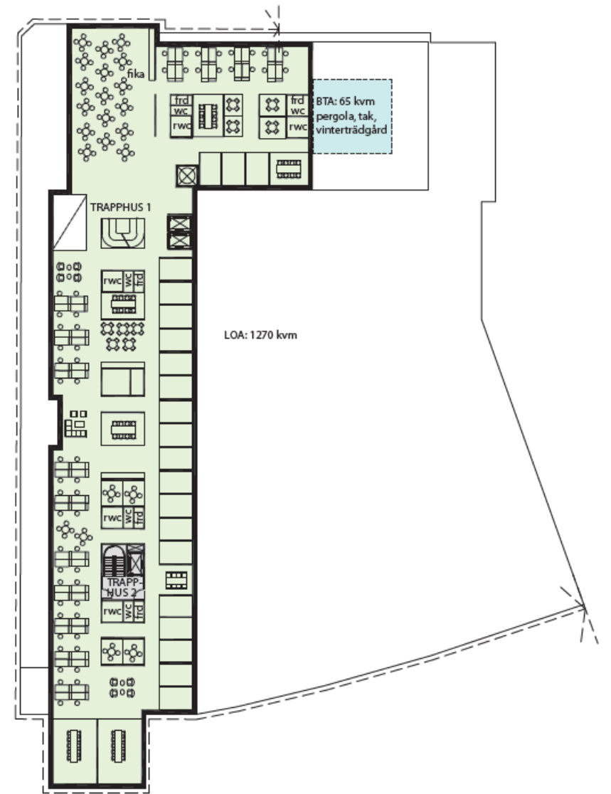
KONTOR - EN HYRESGÄST