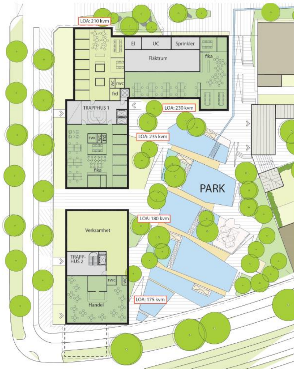
KONTOR - FLERA HYRESGÄSTER