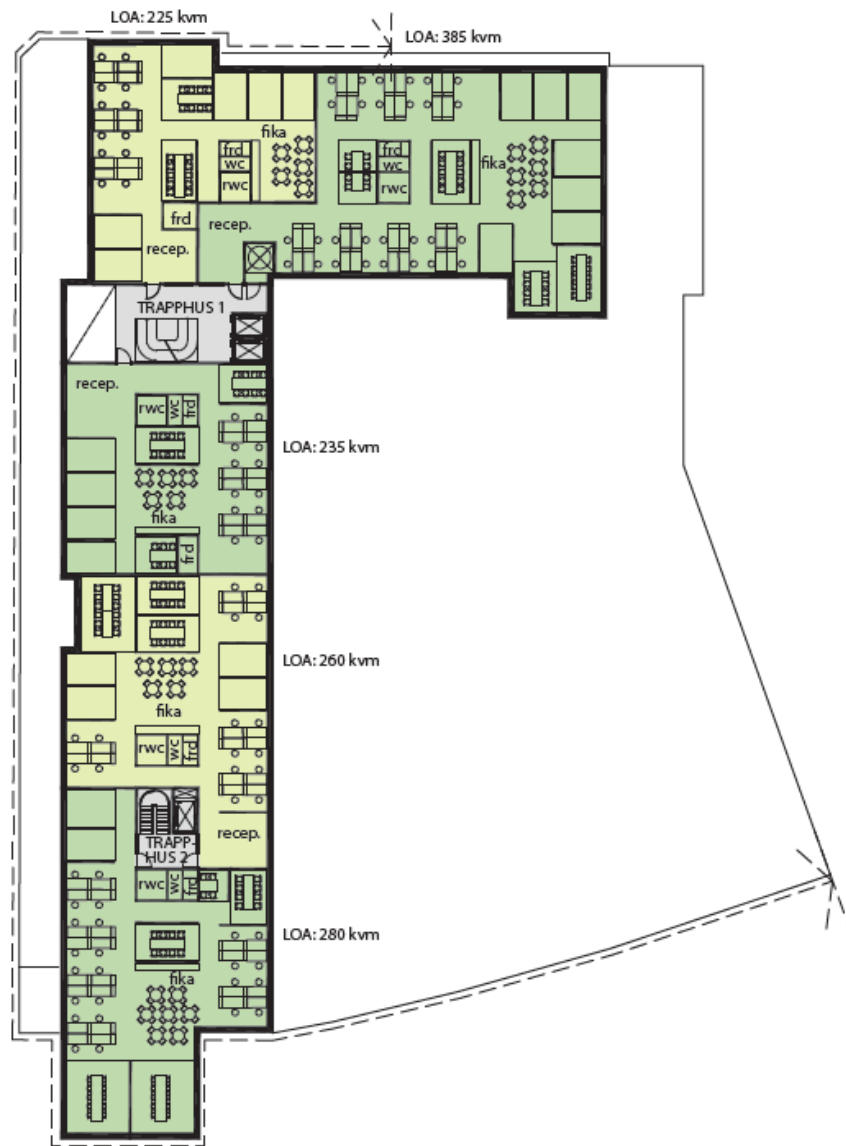
KONTOR - FLERA HYRESGÄSTER