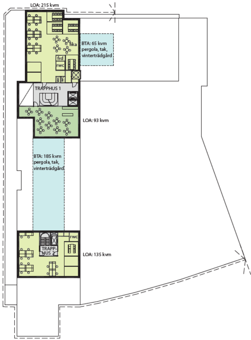
KONTOR - FLERA HYRESGÄSTER